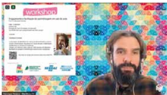
Workshop: Engajamento e facilitação da aprendizagem em sala de aula