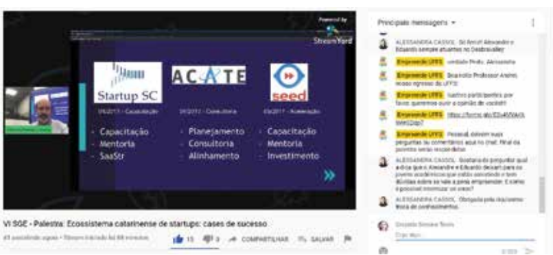
"Ecosistema catarinense de startups: casos de sucesso"