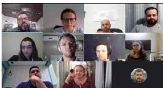
SMART TCC: Transformando trabalhos de conclusão de cursos em negócios inovadores