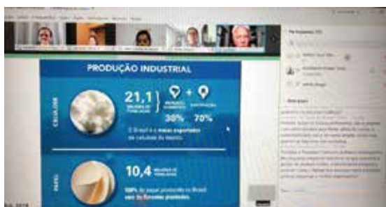
Meetup: Empresas sustentáveis lucram mais