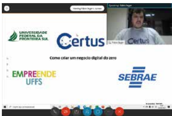
Empreendedorismo Digital: como inovar em momentos de crise